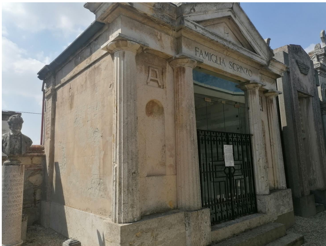
rilievo fotografico del 05.09.2022

RELAZIONE DI STIMA PER DETERMINARE IL PIÙ PROBABILE VALORE DI MERCATO DELL'EDICOLA FUNERARIA EX FAMIGLIA SCRINZO IN CIMITERO DI ROSIGNANO MONFERRATO