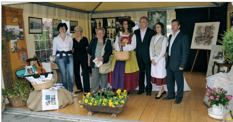
Settembre 2013: lo stand del Comune di Rosignano a "Casale Monfleurs".

"PULIAMO IL MONDO": nell'ambito dell'annuale iniziativa di sensibilizzazione di Lega Ambiente, il Comune di Rosignano ha organizzato una serie di incontri con le Scuole presso il Teatro Ideal sul tema: "Verso Rifiuti zero e Raccolta differenziata". Ne sono stati protagonisti gli studenti della Scuola Media di San Martino di Rosignano, nonché gli studenti della Primaria di Rosignano e delle ultime classi delle Primarie di Frassinello e San Giorgio che si sono confrontati con i dirigenti di Cosmo Spa in interessante approfondimento.