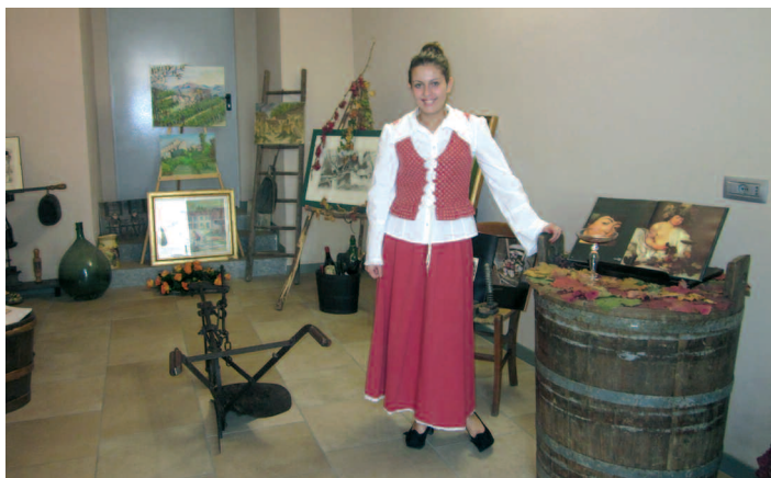
La Monferrina e alcuni attrezzi del costituendo Museo Contadino.

Successo straordinario e foriero di positivi ritorni per tutto il Territorio.